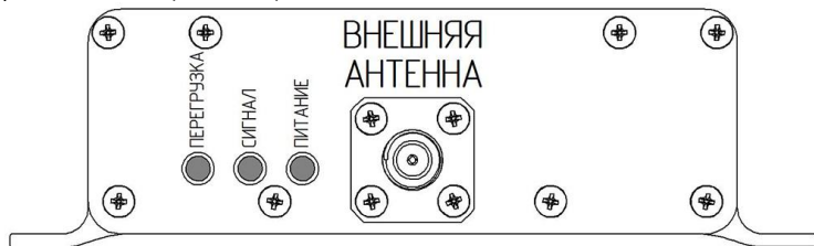
Рисунок 1 – Лицевая панель усилителя с индикаторами

На лицевой панели усилителя размещен разъём для внешней антенны ( ВНЕШНЯЯ АНТЕННА ) и индикаторы режимов работы. На тыльной панели расположен разъём для внутренней антенны ( ВНУТРЕННЯЯ АНТЕННА ) и разъем питания ( ПИТАНИЕ ).