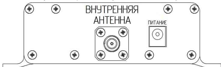
Рисунок 2 – Тыльная панель усилителя