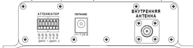
Рисунок 2 – Тыльная панель усилителя

Светодиодные индикаторы помогут правильно настроить систему усиления. Индикаторы «ДИАПАЗОН 1» относятся к диапазону 900 МГц, индикаторы «ДИАПАЗОН 2» - к диапазону 2100 МГц.