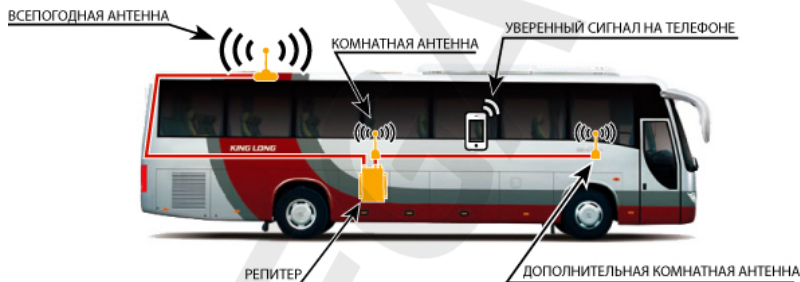
Схема №1. Пример установки репитера в автобусе.

Репитер представляет собой высокочувствительный двунаправленный СВЧ-усилитель сотового сигнала, поэтому при его установке нужно, чтобы всепогодные и комнатные антенны были хорошо изолированы друг от друга и не возникло самовозбуждения репитера. Чтобы на наглядном примере понять, что такое самовозбуждение, возьмите, к примеру, микрофон и громкоговоритель и поднесите их близко друг к другу – вы услышите очень сильный шум. Репитер будет работать бесперебойно только в том случае, если электромагнитная развязка будет достаточной для устойчивой работы системы усиления сотового сигнала.