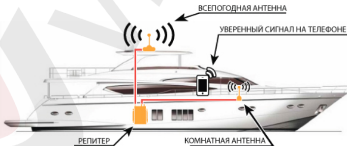
Схема №2. Пример установки системы усиления сотового сигнала на яхте.